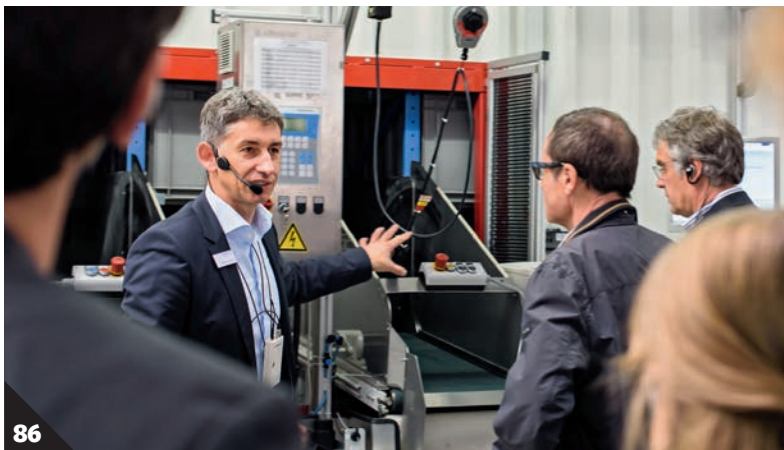
86 Netzwerk impulse-Mitglieder in der Fertigung des Hidden Champions Mennekes

Sekt und Champagner 78 Lange wurden Schaumweine nur als Aperitif serviert. Die neuen Sorten vertragen sich auch vortrefflich mit Speisen